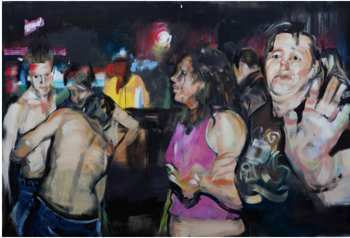
Markus Fräger | Am Ausgang | 2009 | Privatbesitz

Die Ausstellung im Museum Schloss Cappenberg zeigt retrospektiv das malerische Werk von Markus Fräger. Er malte überwiegend figurativ, seine dichten Szenen von fast altmeisterlicher Anmutung mit starken Hell-Dunkel-Kontrasten spielen oft in Innenräumen und erinnern sowohl an die Tradition der Genremalerei als auch an kinematografische Filmstills. Ähnlich wie ein Regisseur setzt Markus Fräger seine Motive in Szene zusammen. Die Komposition der Figuren sowie auch deren Gesten deuten eine Handlung an, die sich aber im Bildgefüge nicht schlüssig zusammensetzt, sondern eine Geschichte mit losen Enden bewusst auf verschiedenen Zeitebenen erzählt. Auch nach einer intensiven Betrachtung bleiben die Szenen rätselhaft, erscheinen manche formalen Elemente ebenso kryptisch wie die inhaltlichen – punktuell zeigen die Strukturen Auflösungserscheinungen und entziehen sich einer Interpretation. Markus Fräger lässt private und intime Momente unbedingter Schönheit und zärtlicher Verletzlichkeit entstehen, die an die Vergänglichkeit eines scheinbar festgehaltenen Moments erinnern.