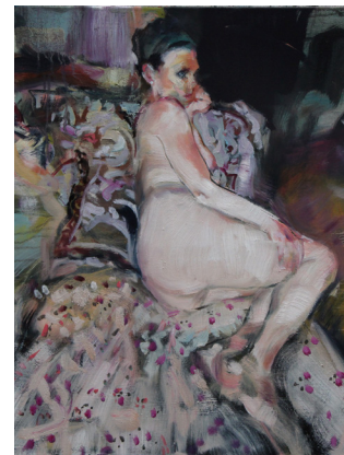
Markus Fräger | Liegender Akt auf Blumendecke | 2017 | Privatbesitz