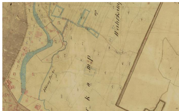
Abbildung 3 (rechts): Ausschnitt Ausschnitt Urkarte