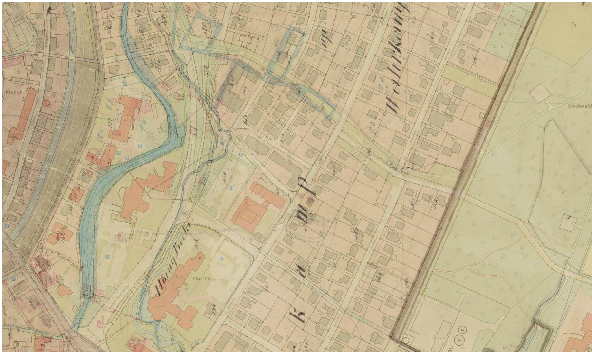
Abbildung 1: Transparenter Ausschnitt Urkarte / Liegenschaftskarte

Für die digitale Bereitstellung wurden alle vorliegenden Urkarten, die entweder Gemarkungen oder einzelnen Fluren umfassen, georeferenziert, aneinandergesetzt und online über einen Web-Client der Firma VertiGIS zur Verfügung gestellt. Hier können sie gemeinsam mit dem aktuellen Liegenschaftskataster transparent dargestellt werden.