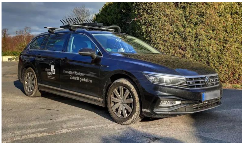
Abbildung 1: Messfahrzeuge der atene KOM zur Ermittlung der realen Mobilfunkversorgung

Koordinierung des Mobilfunkausbaus im Kreisgebiet.