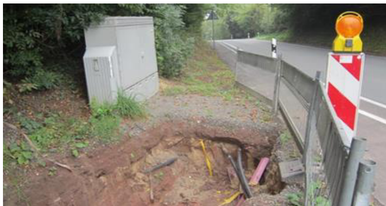
Abbildung 1: Glasfaser-Baustelle

Koordinierung des geförderten Glasfaserausbaus im Kreisgebiet.