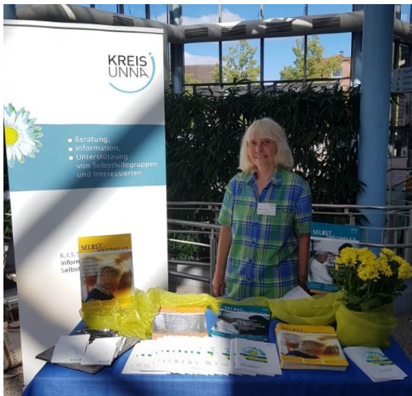
Abbildung 6: Aktionstag Netzwerk Demenz Kamen

Auf einer Versammlung der Frauenhilfe Bergkamen am 17.08. hat eine Mitarbeiterin der K.I.S.S. das vielfältig Unterstützungsangebot im Rahmen der Selbsthilfeförderung des Kreises Unna vorgestellt, ebenso im Rahmen der Team-Sitzung des Sozialpsychiatrischen Dienstes Kreis Unna (Team Süd) am 01.06.