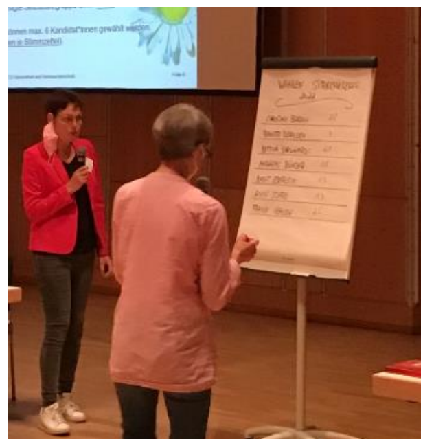
Abbildung 8: Stimmauszählung Sprecherratswahlen | Kreis Unna