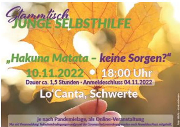
Abbildung 10: Ausschnitt aus Postkarte für den „Stammtisch Junge Selbsthilfe“ | Kreis Unna

An dem Austauschformat für Kontaktstellenmitarbeiter*innen in NRW zum Thema Junge Selbsthilfe beteiligte sich die K.I.S.S. des Kreises Unna auch im Jahr 2022, und zwar am 09.03. Für das zweite Treffen am 06.10. war die Vorstellung der Jungen Selbsthilfe im Kreis Unna geplant. Dieser Termin musste ins Jahr 2023 verschoben werden.