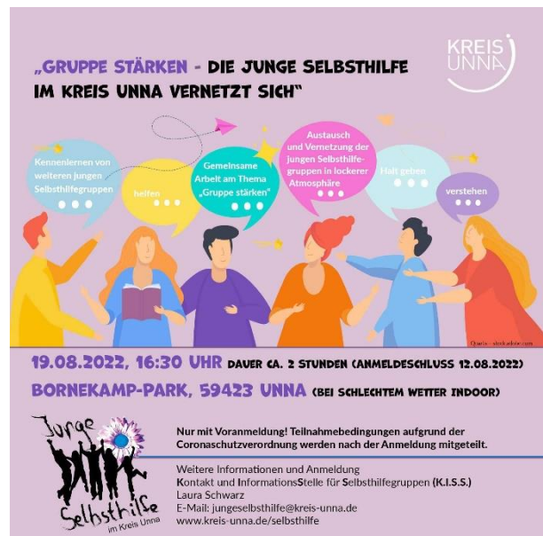
Abbildung 4: Ankündigung

Für die junge Selbsthilfe wurde im Bornekamp-Park Unna das Outdoor-Seminar „Gruppe stärken - Die Junge Selbsthilfe im Kreis Unna vernetzt sich“ am 19.08. erstmalig von zwei Fachkolleginnen angeboten. Mit diesem Konzept sollte, neben der Fortbildung zu gruppenpädagogischen Fragen, ein interner Austausch der jungen Selbsthilfegruppen im Kreis Unna vereint werden. Es kamen die angeschafften Materialien für die Gruppenarbeit (Pedalo-Spielbox, Fröbelturm) zum Einsatz und mit einem gemeinsamen Picknick klang die Veranstaltung aus.