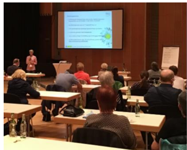
Abbildung 5: kreisweites Gesamttreffen

Das kreisweite Gesamttreffen fand am 12.05. in der Stadthalle Kamen statt und es nahmen 37 Selbsthilfegruppen aus allen Kommunen des Kreises Unna teil. Im Vordergrund dieses Treffens stand, neben den aktuellen Informationen der K.I.S.S., die Wahlen des Sprecherrates (weitere Infos Kap. 4).