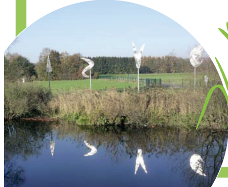
„Sieben Zeichen“ an der Ruhr