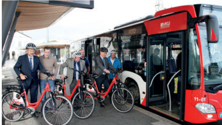
Mit dem Bus zum Bahnhof und dann mit dem E-Bike weiterfahren: Ein Angebot von VKU und Radstation.

Die RADSTATIONEN verstehen sich heute schon als Kern moderner Mobilstationen. In den Stationen finden Kunden des Nahverkehrs alle Informationen über das Angebot an den Bahnhöfen und Busbahnhöfen des Kreises.