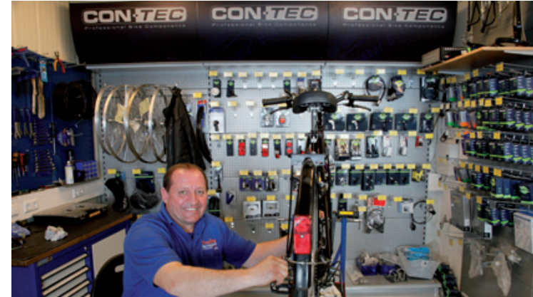
Reparaturen, Ersatzteilverkauf oder auch Codierung: Unser Meisterbetrieb bietet den Full-Service.

Die RADSTATIONEN im Kreis Unna bringen Sie auf Touren: Alle Stationen bieten Ihnen das komplette Programm zur Pflege und Wartung Ihres Zweirades. Unter der Leitung eines erfahrenen Zweirad-Mechanikermeisters arbeiten unsere Teams in den Werkstätten.