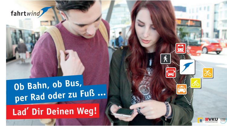
Die schnellsten und komfortabelsten Wege zeigt die fahrtwind-App. Auch eTickets gibt es per APP.

Den flotten „fahrtwind“ für alle Wege gibt es im Kreis Unna kostenlos und für die Jackentasche: Eine App zeigt für die gewünschte Strecke nicht nur Bus-, Bahn-, und Fußwege auf einen Blick. Das Fahrrad und das Leihrad sind als Mobilitätsangebote voll integriert.