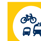
Info zu Bahn, Bus und Rad