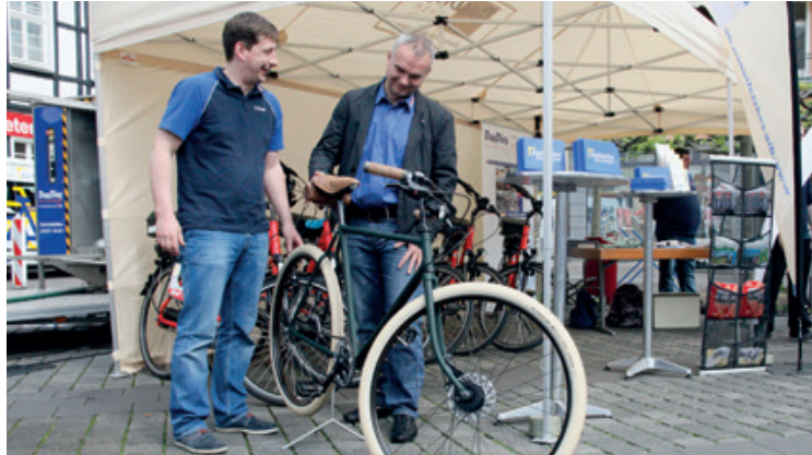
Eine große Auswahl an aufbereiteten Gebrauchträdern bieten die Radstationen zum Verkauf an.

Es muss nicht immer das neue Top-Modell sein: Die RADSTATIONEN bieten eine große Auswahl an Gebrauchträdern an. Ob Kinderrad, Tourenrad, Rennrad oder Faltrad: Wir überholen ausgemusterte Fahrräder und bieten diese zu attraktiven Preisen an.