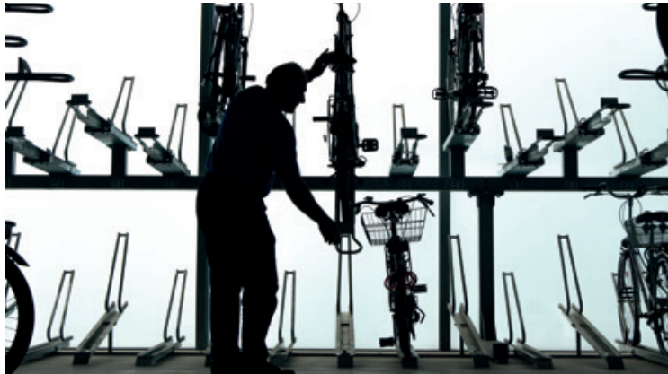
Sinnvolle Beschäftigung für benachteiligte und behinderte Menschen bieten die Radstationen.

Neben der Aufgabe im Nahverkehr sind die RADSTATIONEN wichtige Akteure im sozialen Arbeitsmarkt. Sie schaffen Arbeitsplätze für benachteiligte Menschen. In den Radstationen sind 21 Fachkräfte in einem wachsenden Mobilitätssektor dauerhaft beschäftigt. Über die Hälfte sind Menschen mit Behinderungen.