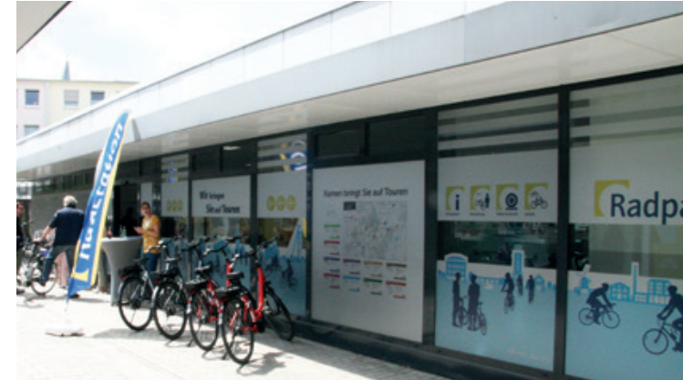
Radparkhäuser wie hier in der Kamener Innenstadt ergänzen das Netz der Radstationen im Kreis Unna.

Das Netz unserer Stationen wächst: Neben den RADSTATIONEN finden die Radlerinnen und Radler inzwischen zahlreiche RADPARKHÄUSER, die von unseren Teams mit betreut werden.