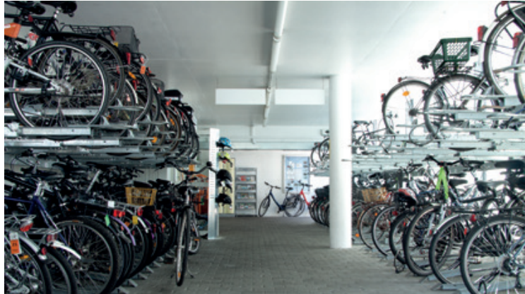
Täglich rund um die Uhr können registrierte Kunden in unseren Stationen ihr Fahrrad abstellen.

An allen RADSTATIONEN und RAD-PARKHÄUSERN im Kreis Unna können Sie Ihr Fahrrad rund um die Uhr sicher parken. Mit einem Jahres- oder Monatsabo oder einem Prepaid-Chip erhalten Sie Zugang zu Ihrem Stellplatz, wettergeschützt und videoüberwacht. Durch die attraktive Lage in Bahnhofsnähe bzw. in der Stadtmitte können Sie Ihr Rad beim Bummeln in der Stadt oder beim täglichen Pendeln zur Arbeit unbesorgt zurücklassen.