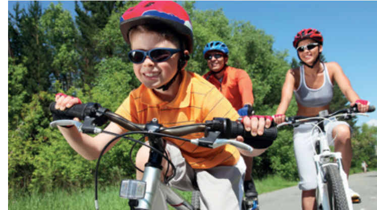
Die Karten für die schönsten Touren im Kreis und in der Region gibt es in unseren Radstationen.

Der RuhrtalRadweg, die Römer-Lippe-Route, der Seseke-Radweg, die Tour „RadKreisUnna“... Nur einige von etlichen Radrouten, die durch den fahrradfreundlichen Kreis Unna führen.