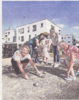
Das Mehrgenerationenwohnen an der Mozartstraße wurde ausgezeichnet.