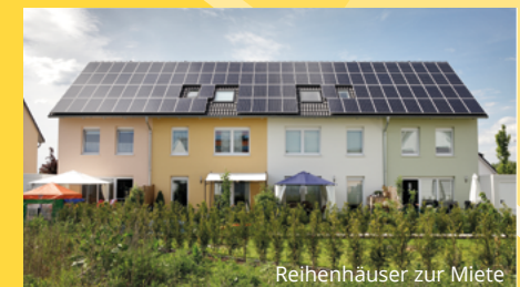
Reihenhäuser zur Miete

Weitere Informationen zu diesem Projekt: www.nwf-unna.de