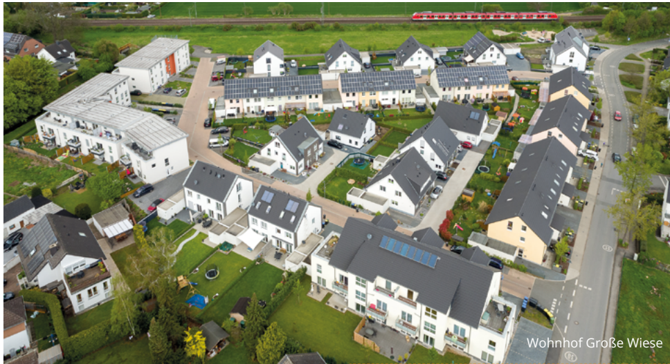
Wohnhof Große Wiese