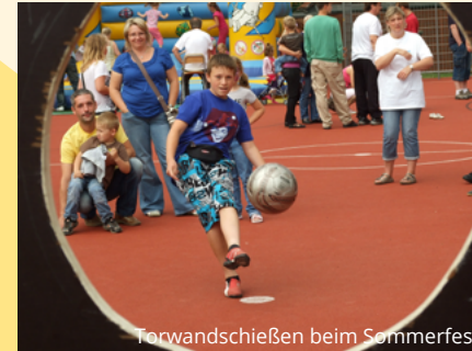
Torwandschießen beim Sommerfest