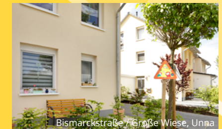
Bismarckstraße / Große Wiese, Unna

Weitere Informationen zu diesem Projekt: