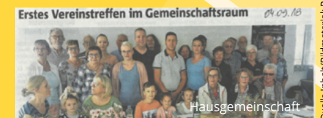
Erstes Vereinstreffen im Gemeinschaftsraum Hausgemeinschaft