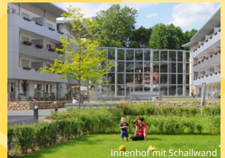
Innenhof mit Schallwand