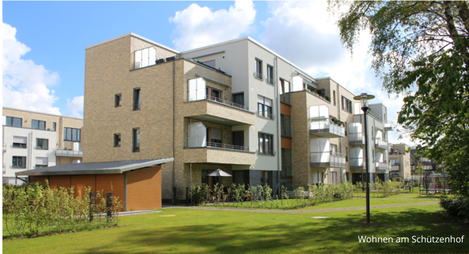
Wohnen am Schützenhof