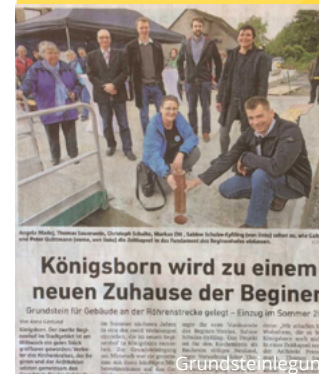
Königsborn wird zu einem neuen Zuhause der Beginen