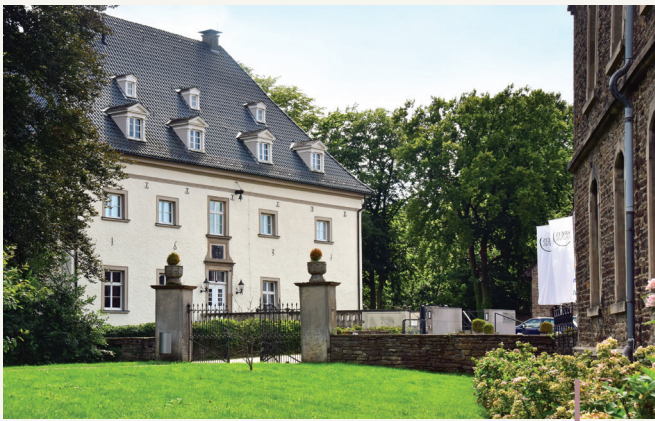
Haus Opherdicke, Seitenansicht