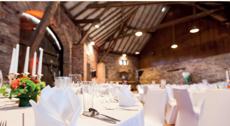
Die Scheune bietet allen Gästen ausreichend Platz

Der Hochzeitsflügel im Haupthaus macht alles möglich: Heiraten im Kaminraum*, Sektempfang im Turmraum und auf dem angrenzenden Balkon, Bankett und Feier im Spiegelsaal. Noch mehr Platz für noch mehr Familie und Freunde bieten Bauhaus und die Scheune.